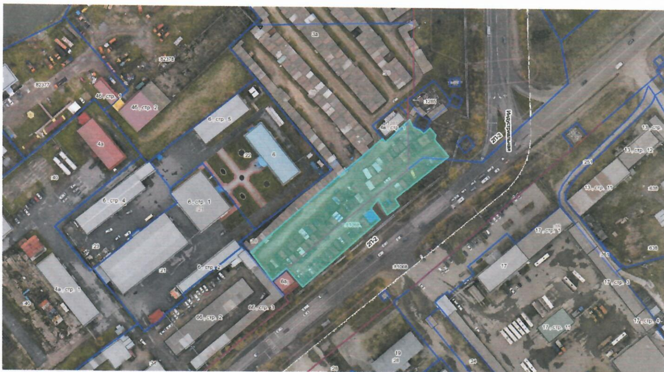
Схема из программного комплекса МГИС г. Нижневартовска