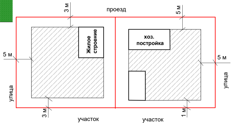
Схема размещения зоны застройки земельных участков