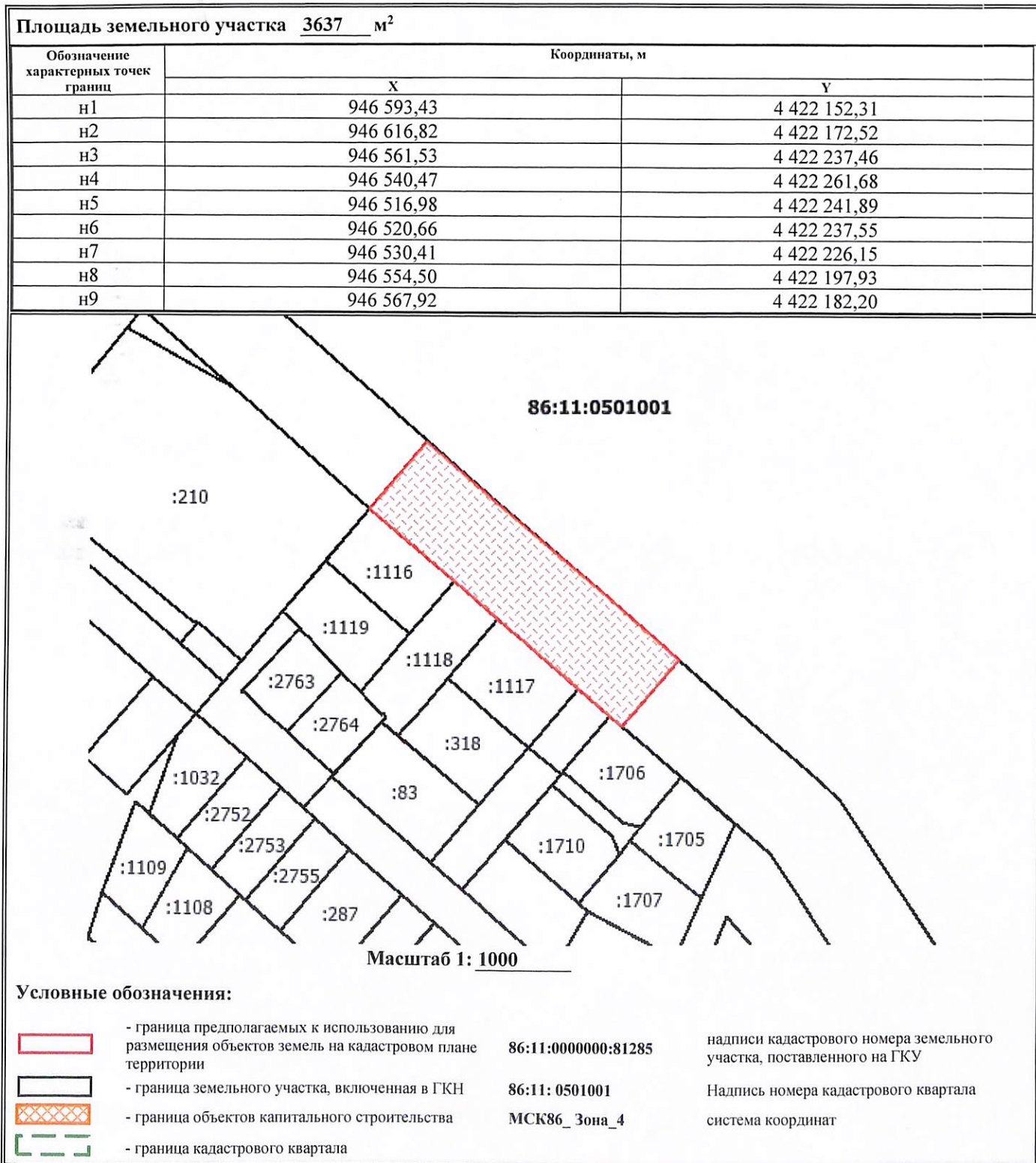
Схема границ сервитута на кадастровом плане территории