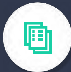
Свод инвестиционных правил